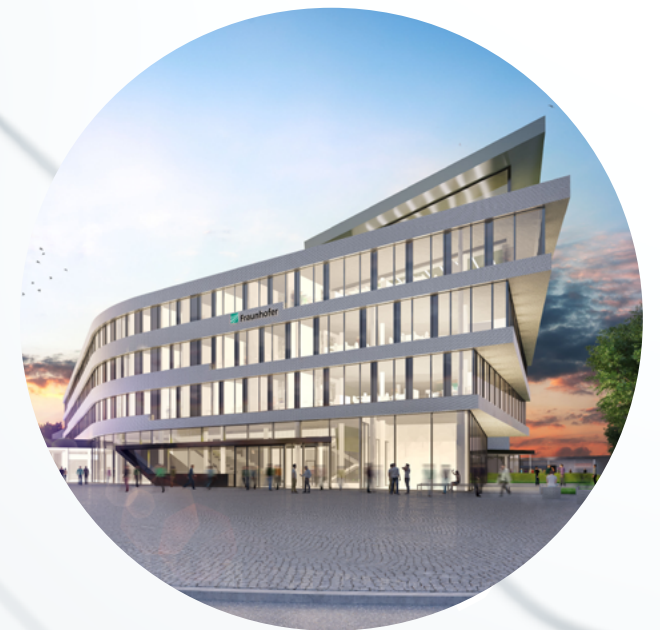
Zukünftiger Standort des District LAB: Fraunhofer IEE Neubau in Kassel